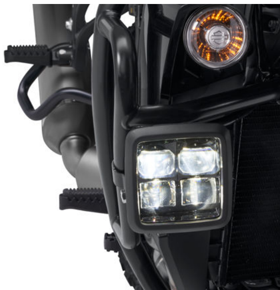
Moto con luci frontali ausiliarie a LED Daymaker*