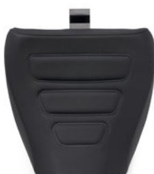
Sella monoposto Reach – Pan America™ 1250