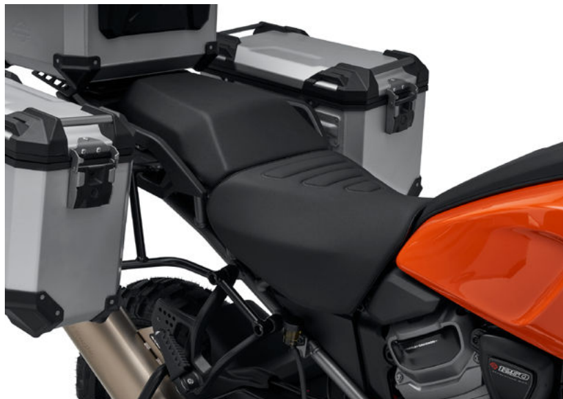
Moto con sella monoposto Tallboy – Pan America™ 1250