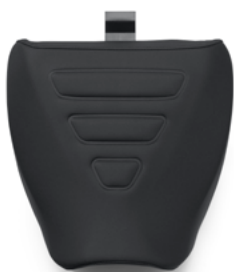
Sella monoposto Tallboy – Pan America™ 1250