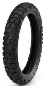
Pneumatico anteriore off-road Michelin® Anakee Wild – 120/70R19