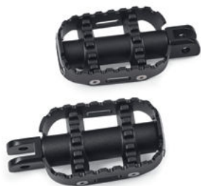
Pedalina poggiapiedi per guidatore 80GRIT™ – Nera