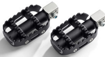
Pedalina poggiapiedi passeggero 80GRIT™ - Nera