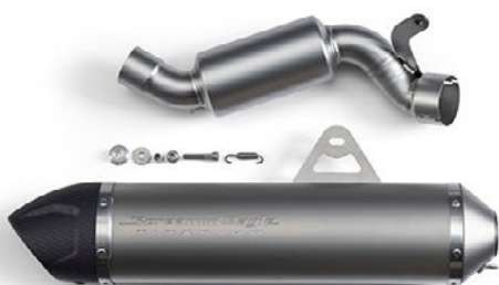
Marmitta Street Cannon Screamin' Eagle® - Pan America™