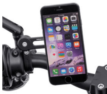
Portacellulare universale + supporto per manubrio