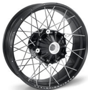
Ruota a raggi da 43,18 cm (17") – Posteriore