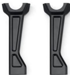
Montanti rialzati Pan America – Neri