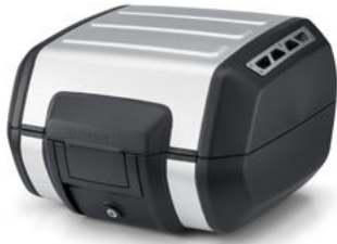
Bauletto rimovibile Sport Pan America