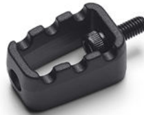
Pedalina del selettore delle marce 80GRIT™ - Nera