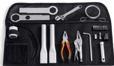
Kit attrezzi Harley-Davidson