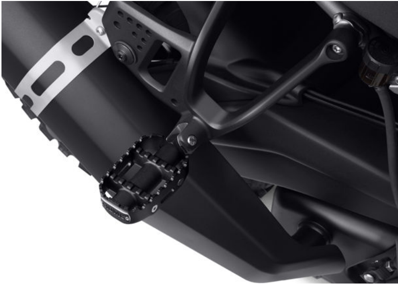
Moto con pedalina poggiapiedi passeggero nera