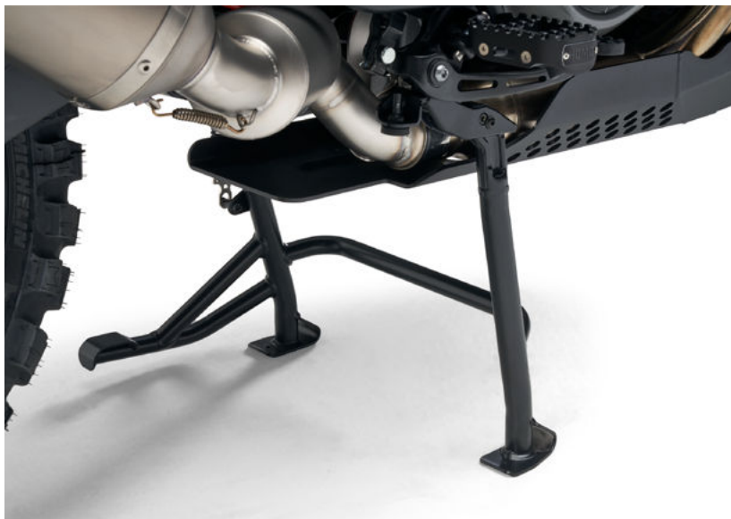
Moto con cavalletto centrale