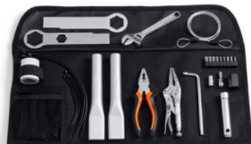
Kit attrezzi Harley-Davidson