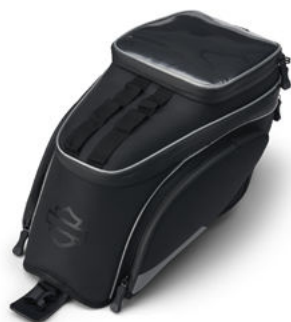
Borsa da serbatoio – Pan America