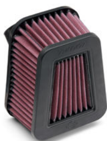
Filtro dell'aria Screamin' Eagle® a flusso estremo - Pan America