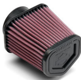
Filtro dell'aria Screamin' Eagle® a portata maggiorata - Placca