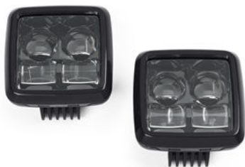
Kit di installazione luci ausiliarie – Pan America™