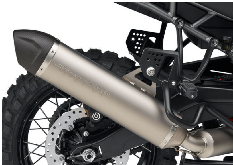
Moto con marmitta Street Cannon Screamin' Eagle® - Pan America™

Harley-Davidson ha creato delle combinazioni consigliate di assortimenti di accessori che suggeriamo di abbinare insieme per personalizzare la tua moto.