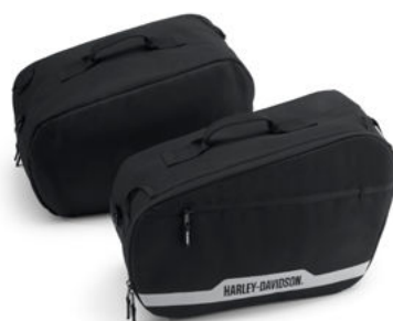
Fodere per bauletti laterali Sport Pan America™