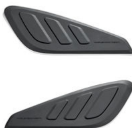
Kit imbottitura ginocchia per serbatoio (2 pz.) – Pan America