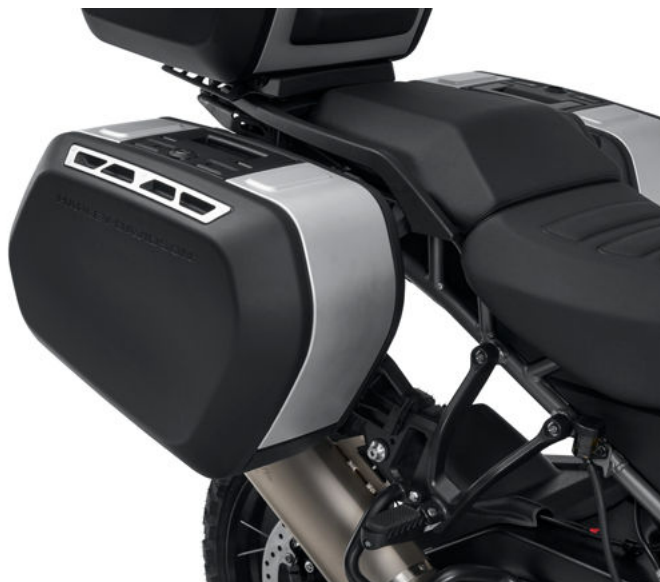
Moto con bauletti laterali Sport Pan America™