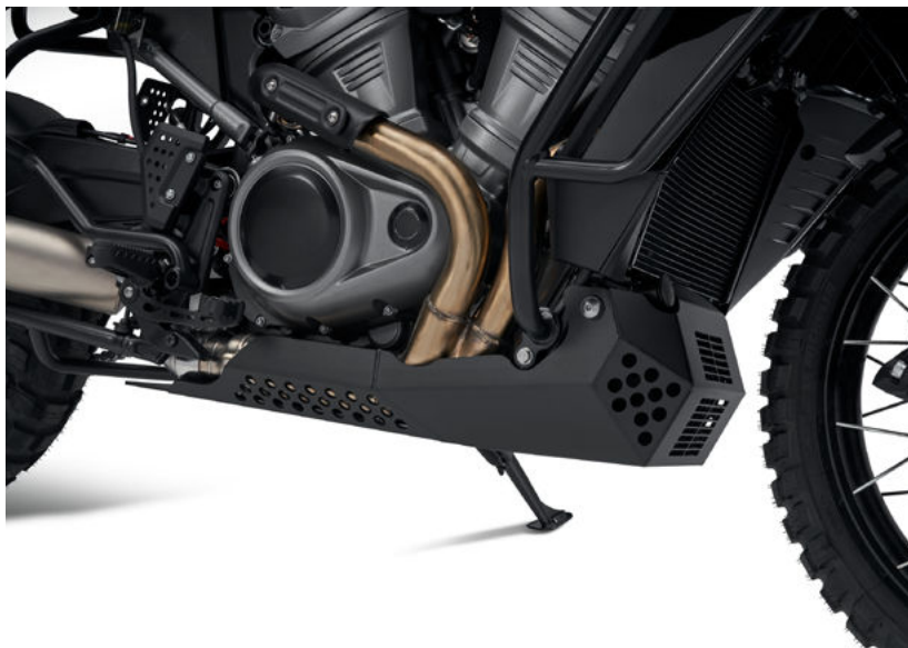
Moto con piastra paramotore