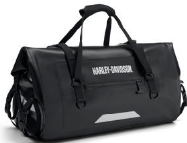
Borsone da viaggio in tessuto Adventure Pan America